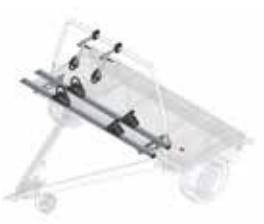
2 fietsen voor de bevestigingsbeugel