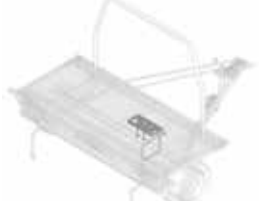
Reservewielhouder voor wiel aanhanger