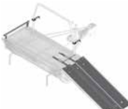
MP3 met 3-delige oprijplaat.