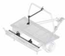
1 fiets op uitschuifbare bumper