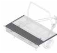
Laadvlakverlenging tot 1100 mm