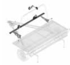
1 fiets voor de bevestigingsbeugel