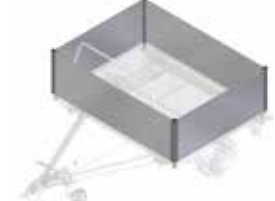
Aluminium zijwanden van 600 mm hoog