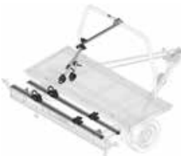
2 fietsen op uitschuifbare bumper