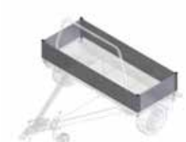
Aluminium zijwanden van 300 mm hoog