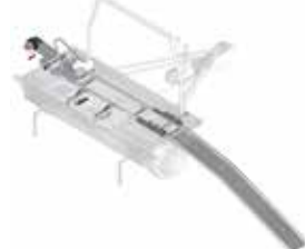
Hefinrichting voor motorfiets