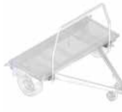
Vastzetbeugel voor platform