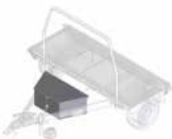
Alu-box voor V-dissel