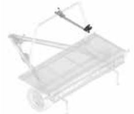
Bevestigingsarm voor stuurslot