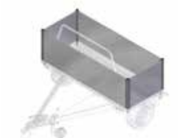
Aluminium zijwanden van 600 mm hoog