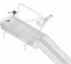
Handmatige lier met omkering