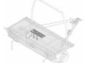
Reservewielhouder voor voertuigwiel