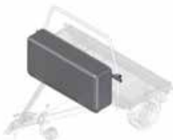
Ultra-box voor V-dissel