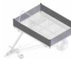
Aluminium zijwanden van 300 mm hoog